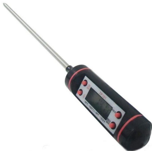
Электронный термометр для пищи TP-101